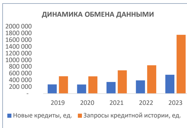
Рис.4 Динамика поступления информации по новым кредитам и запросов кредитной истории за 3 кв. 2019-2023 гг.

Динамика поступления информации по новым кредитам и запросов кредитной истории за 3 кв. каждого года с 2019 по 2023 гг., выглядит следующим образом (рис.4):