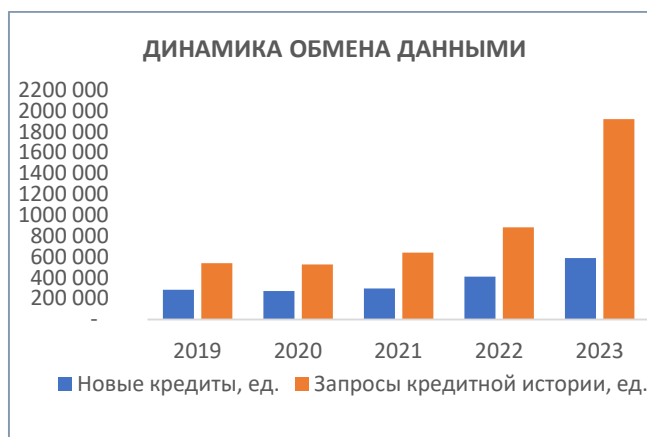
Рис.4 Динамика поступления информации по новым кредитам и запросов кредитной истории за 4 кв. 2019-2023 гг.

Динамика поступления информации по новым кредитам и запросов кредитной истории за 4 кв. каждого года с 2019 по 2023 гг., выглядит следующим образом (рис.4):