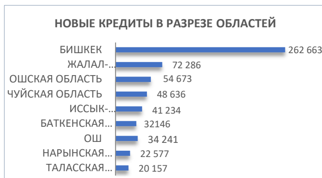
Рис.5 Распределение поступления информации по областям

В разрезе областей количество новых кредитов, информация по которым была передана в КБ «Ишеним» за 4 кв. 2023 года, выглядит следующим образом (рис.5):