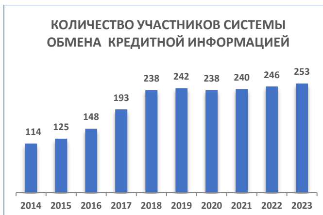
Рис.2 Динамика количества участников системы обмена данными

КБ «Ишеним» в 4 кв. 2023 года получило информацию о 588 613 новых кредитах, из них 306 822 кредита было передано банками и 281 791 кредитов микрофинансовыми и прочими организациями (рис.3):