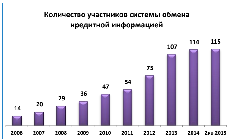
Рис.2 Динамика количества участников системы обмена данными

КИБ «Ишеним» за 1 кв. 2015г. получил информацию о 106 838 новых кредитах, из них 66 386 кредитов было передано микрофинансовыми организациями и кредитными союзами и 46 452 кредитов банками (рис.3):