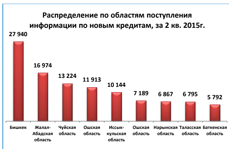
Рис.5 Распределение поступления информации по областям

В разрезе областей количество новых кредитов информация, по которым была передана в КИБ за 2 кв. 2015 года, выглядит следующим образом (рис.5):