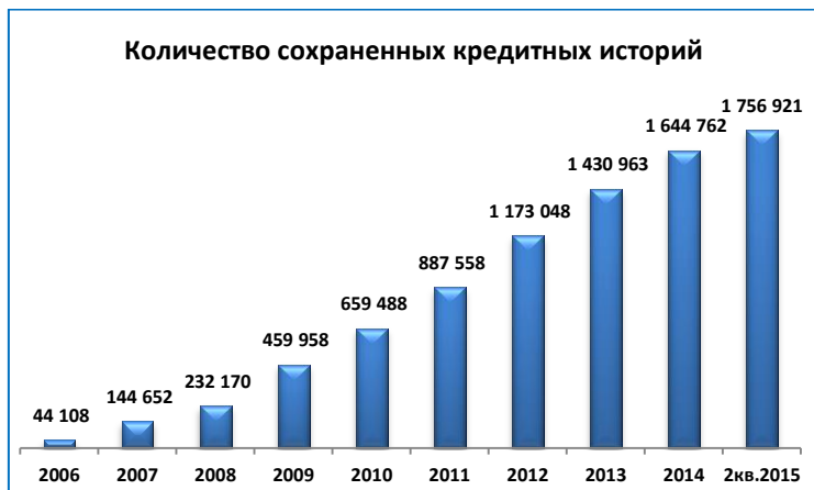
Рис.1 Динамика количества сохраненных кредитных историй

КИБ «Ишеним» управляет постоянно растущей базой данных о заемщиках (субъектах кредитных историй), в которой на 30 июня 2015г. сохранено 1 756 921 кредитных историй (рис.1).