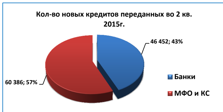
Рис.3 Количество новых кредитов переданных во 2 кв. 2015г.

КИБ «Ишеним» за 1 кв. 2015г. получил информацию о 106 838 новых кредитах, из них 66 386 кредитов было передано микрофинансовыми организациями и кредитными союзами и 46 452 кредитов банками (рис.3):